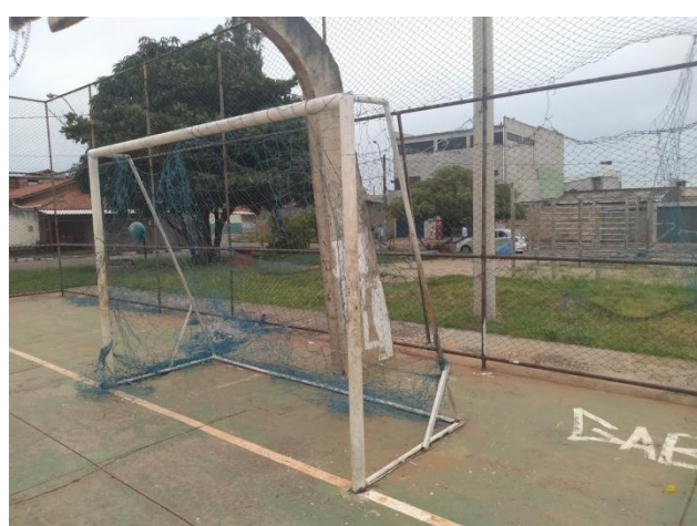
Foto 10: Vista da trave – necessitando de instalação da rede de proteção.