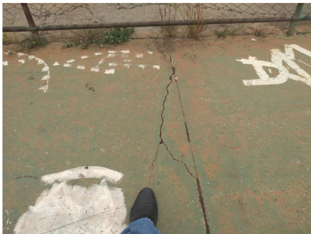
Foto 5: Vista interna da quadra – Piso em concreto com desgaste, trincas e fissuras, necessitando de recuperação.