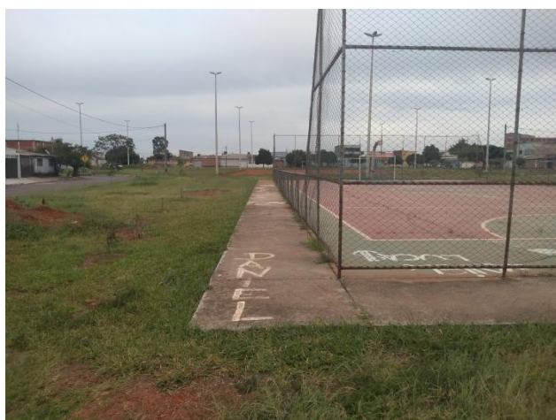
Foto 16: Vista externa da quadra – Calçada em concreto em bom estado de conservação, necessita de limpeza e recuperação das juntas de dilatação.