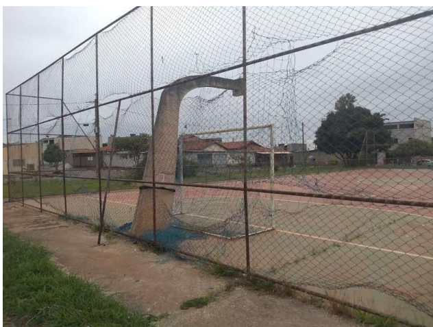
Foto 17: Vista externa do alambrado – Estrutura do alambrado instável. Necessita de Instalação de escoras para dar sustentação ao alambrado.