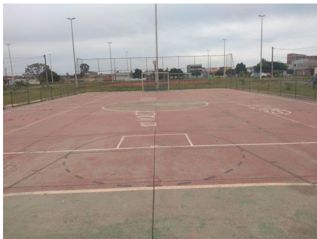
Foto 12: Vista interna quadra – falta estrutura e rede de voleibol.