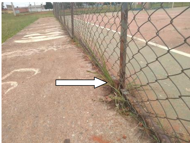
Foto 7: Vista do alambrado – Estrutura quebrada necessitando de recuperação.