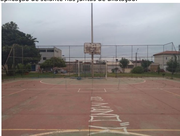
Foto 15: Vista interna da quadra – Pintura degradada, necessitando de nova pintura e demarcação das atividades de esportes.