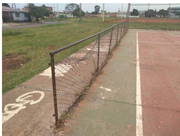
Foto 2: Vista externa da quadra - Estrutura tubular do alambrado quebrado e degradado pela corrosão, necessitando de recuperação.