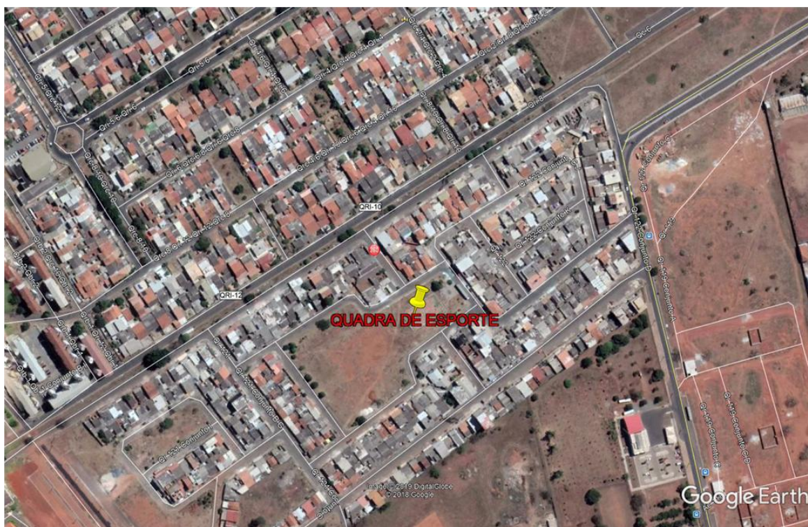
Foto aérea com Localização da Quadra de Esporte