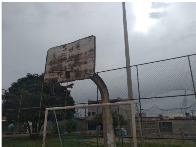
Foto 11: Vista da tabela de basquetebol – As tabelas estão danificadas, necessitando de substituição por novas tabelas com aro e rede.