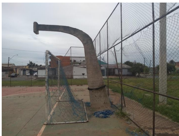
Foto 18: Vista interna do alambrado – tela do alambrado danificada, necessitando de substituição.