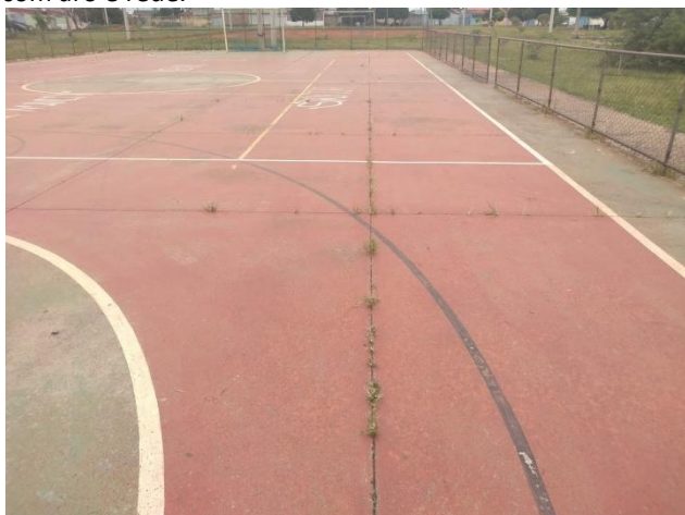
Foto 13: Vista interna da quadra – Vista das juntas de dilatação com ervas daninhas. Precisa de limpeza e aplicação de selante nas juntas de dilatação.