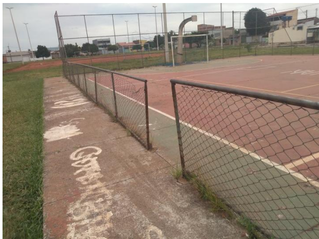
Foto 3: Vista externa da quadra - Sem portão de entrada, necessitando de instalação de novos portões.