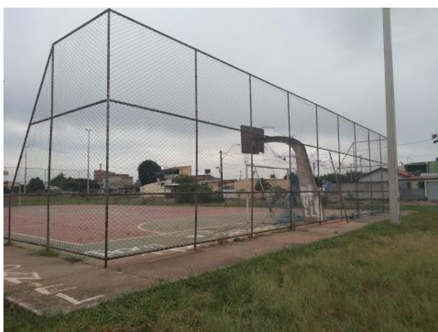
Foto 1:– Vista externa da quadra – Estrutura do alambrado em bom estado de conservação necessitando de pintura, reparos na estrutura e instalação de escoras de apoio.