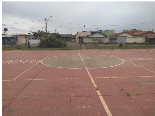
Foto 4: Vista interna da quadra - O piso em concreto em bom estado, necessitando de limpeza das juntas de dilatação e aplicação de selante nas juntas.